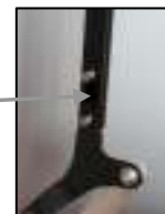
M6 X 30 Schrauben